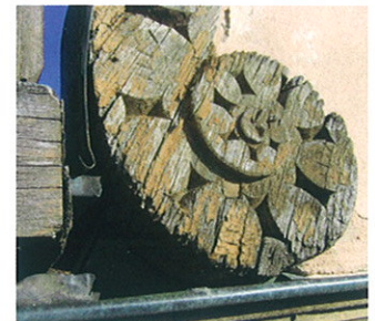
Morsche Fassadenzier im Vorzustand