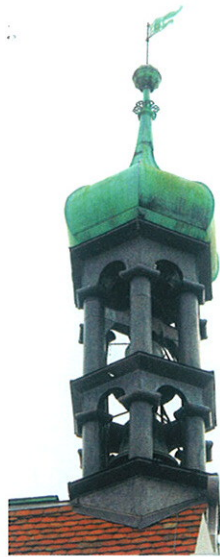
Dank der Maßnahme ist das Giebeltürmchen wieder standsicher geworden

Die Dachsanierung stellte eine Herausforderung dar. Mit zimmermannsmäßigen Reparaturen konnte die Statik des Dachstuhls wiederhergestellt werden. Dabei musste unter anderem eine Stuhlschwelle ausgetauscht werden. Es galt weiterhin, den instabil gewordenen Dachreiter mit Hilfe langer Konstruktionshölzer zu fixieren. In einem komplizierten Verfahren gelang es, die Hölzer einzufügen, ohne dass der Dachreiter abge-