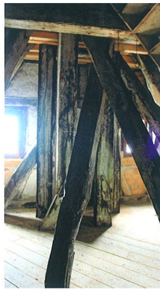
Das mächtige Dachtragwerk unterhalb des Giebelturms