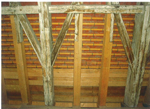
An der Ostseite musste die Dachkonstruktion saniert werden

baut werden musste. Dank der alten, wiederverwendeten Ziegel hat die neue Eindeckung an der Westseite eine vortreffliche Wirkung. Ebenso war die Fassade Gegenstand der Maßnahme. An der gesamten Putzoberfläche zeigten sich Verwitterungsschäden und Rissbildungen. Im Sockelbereich war der Bau stark durchfeuchtet und versalzen. Daher musste der Putz großflächig abgenommen und neu aufgebaut werden. Die morschen hölzernen Filialtürmchen und Voluten erneuerte man, entweder in Teilen oder komplett, in Eichenholz. Das nunmehr perfekte Äußere der Ratstrinkstube lässt den gesamten Umfang der Sanierungsmaßnahme kaum erkennen. Seine langfristige Sicherung verdankt das Rothenburger Wahrzeichen nämlich primär den von außen unsichtbaren, vorbildlichen Maßnahmen im Dach.