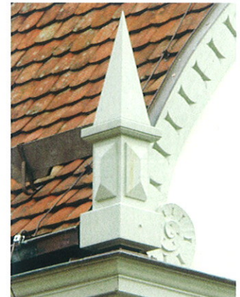
Erneutes Fassadendetail aus Holz