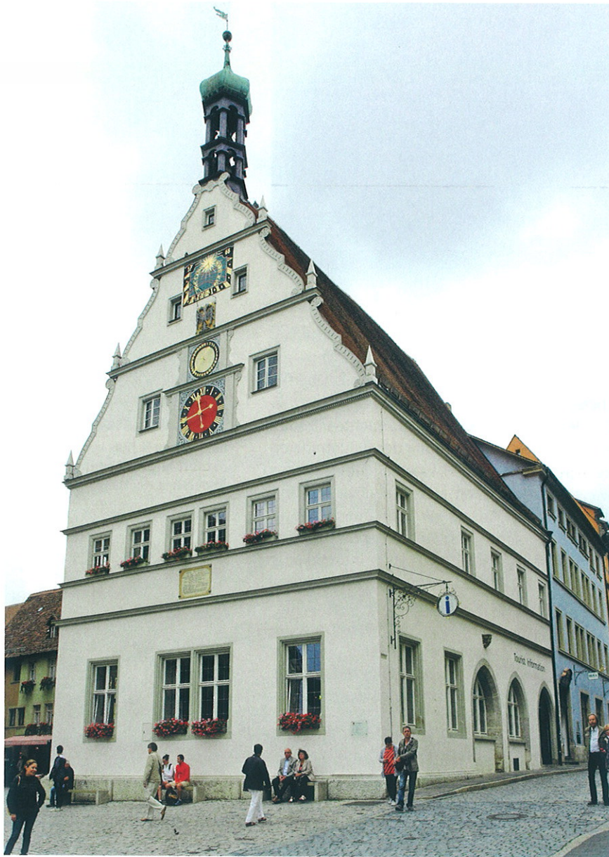
Die attraktive Fassade der „Ratstrinkstube“ im Sommer 2015